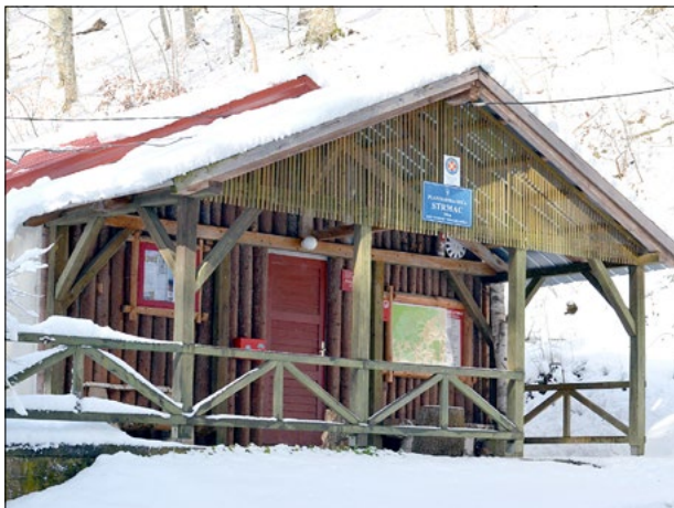
Planinarska kuća Strmac (350 m)

„Strmac“ iz Nove Gradiške. Dobar je Željko Brčić Duša 098 195 23 20. U neposrednoj blizini nalaze se dvije umjetne stijene za penjanje, manja uređena livada sa stolovima, klupama, nadstrešnicom i pečenjarom. Šumarija je 1988. godine novogradiškim planinarima darovala aluminijsku montažnu baraku. Baraku je Crveni križ dobio na poklon kao ostavštinu Američke vojske korištenu u 2. svjetskom ratu kao bolnicu i smjestio je na Strmcu.