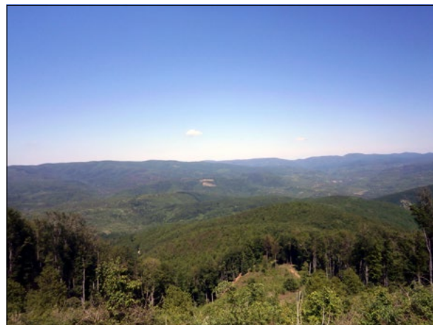
Pogled na zapadni i središnji Papuk sa sjeveroistočnog obronka Javorovice (912 m)

služila u istu svrhu kao i metalni radio-amaterski stup. No bilo kako bilo nikako se ne preporuča penjanje na nju, kao ni na željezni radio-amaterski stup. Sa njih ionako ne bismo ništa pogledima dohvatili, zbog visokih okolnih stabala koja ih nadrastaju.