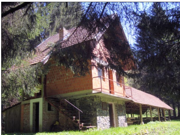
Šumarijska kuća na Vodostaju (660 m)

planinari na svojim čestim prolascima ovim šumskim područjem. Područje oko Šumarijske kuće na Vodostaju posebno je ugodna šumska lokacija na Psunj. Po obližnjem izvoru Vodostaj ime je dobilo i okolno područje.