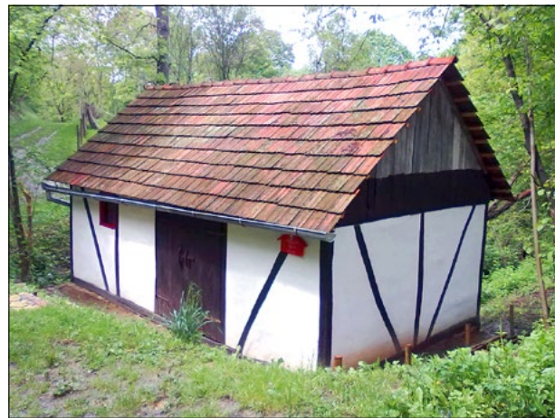
Planinarsko sklonište Točkica (282 m) u zaselku Gagići

za 10ak minuta hoda u zapadnom smjeru, dolazi se na odličan vidikovac. To je trigonometrijska točka Brdo (321 m) s koje se šire izuzetno lijepi pogledi na pakračko-lipički kraj, ali i dalje. Svakako se treba potruditi i obići ovaj vidikovac, jer je jedan od rijetkih koji pružaju široke vidike uz trasu Planinarskog puta Psunjem.