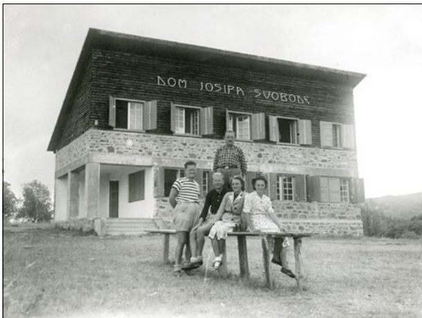
Planinarski dom Josipa Svobode (710 m) na Velikoj poljani