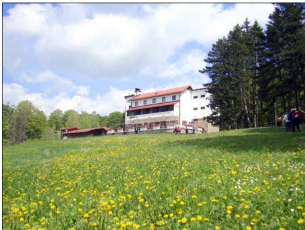
Planinarski dom Omanovac (655 m)

uređena mjesta s roštiljima, veliki natkriti roštiljarnici i pečenjara niže u šumi, suvremeno i sadržajima bogato dječje igralište „Kuna“, umjetna stijena za penjanje, košarkaško, odbojkaško i nogometno igralište. Nešto niže na sjevernoj padini brda nalazi se rekreativna skijaška staza „Ivica Kostelić“ s vučnicom dužine 400 metara. Livadu ispred doma koriste letači paraglajderi za svoja uzlijetanja. S otvorene terase doma pružaju se pogledi na Pakrac i Lipik u nizini. Prostrani vidici šire se na gotovo cijeli pakračko-lipički kraj, kao i na brojna udaljenija mjesta. Za dobre vidljivosti pogled seže do Samoborskog gorja (Plešivica), Medvednice, Moslavačke gore, te zagorskih planina: Kalnika, Ivančice i drugih. Do planinarskog doma Omanovac može se doći za 2,5 sata hoda od grada Pakraca, dok su od grada Lipika potrebna gotovo 3 sata. Od križanja planinarskih staza koje se nalazi uz veliku livadu kod doma, usmjeravaju nas putokazi prema brojnim planinarskim odredištima na Psunju i zapadnom Papuku. Do doma vodi i asfaltna cesta preko sela Kraguj