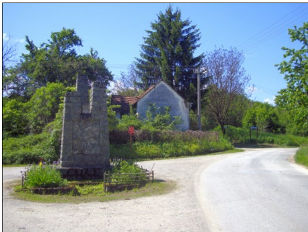
Selo Skenderovci-Brod (160 m), polazišna točka Planinarskog puta Psunjem

Selo Skenderovci-Brod (160 m) malo je i slabo naseljeno selo smješteno na zapadnim obroncima Psunjja. Planinarski put Psunjem počinje u njegovom skromnom središtu kod kamenom uzidanog spomenika bez posebnih obilježja. Ovdje je na križanju planinarskih staza i cesta u zavojitom dijelu sela uz asfaltnu cestu, postavljen drveni stupac sa planinarskim putokazima. Od ovog križanja planinarskih staza (160 m), u sjeveroistočnom smjeru kroz šumarke i preko livada uz sliv potoka Šeovice, te kroz selo Šeovicu, a u šumskom području uz Debeli rt, vodi markirana staza do planinarskog doma Omanovac (655 m), do kojeg ima 2 sata hoda. U smjeru sjevera vodi markirana staza za Lipik, koja ispočetka ide asfaltnom cestom do sela Šeovice, od kojeg nastavlja